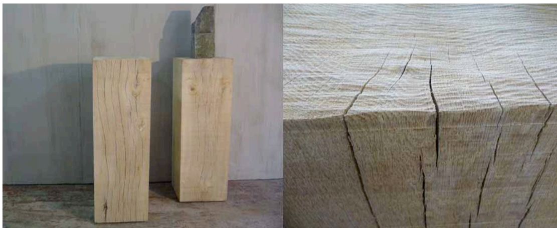
Mobiele Massieve Zuilen: 1 cm van grondoppervlak – onzichtbaar.

Bij Malvini gaat de voorkeur naar natuurlijke en duurzame materialen waardoor het meubel een rijke en tijdloze uitstraling krijgt.