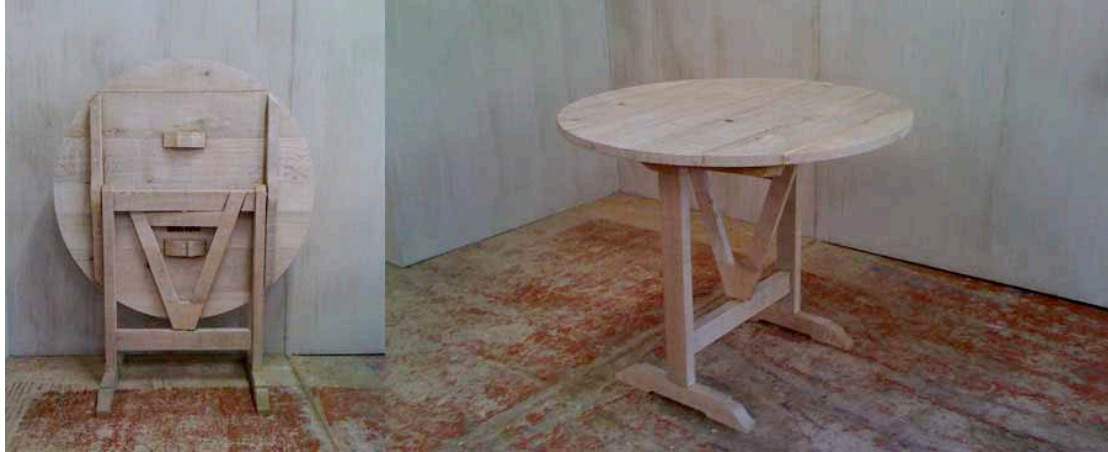
Olivia 90 cm

Pronkstuk is de wijntafel, de bekende vigneron, een oud beproefd ontwerp dat het goed doet in de wijnkelder, eetkamer of orangerie.