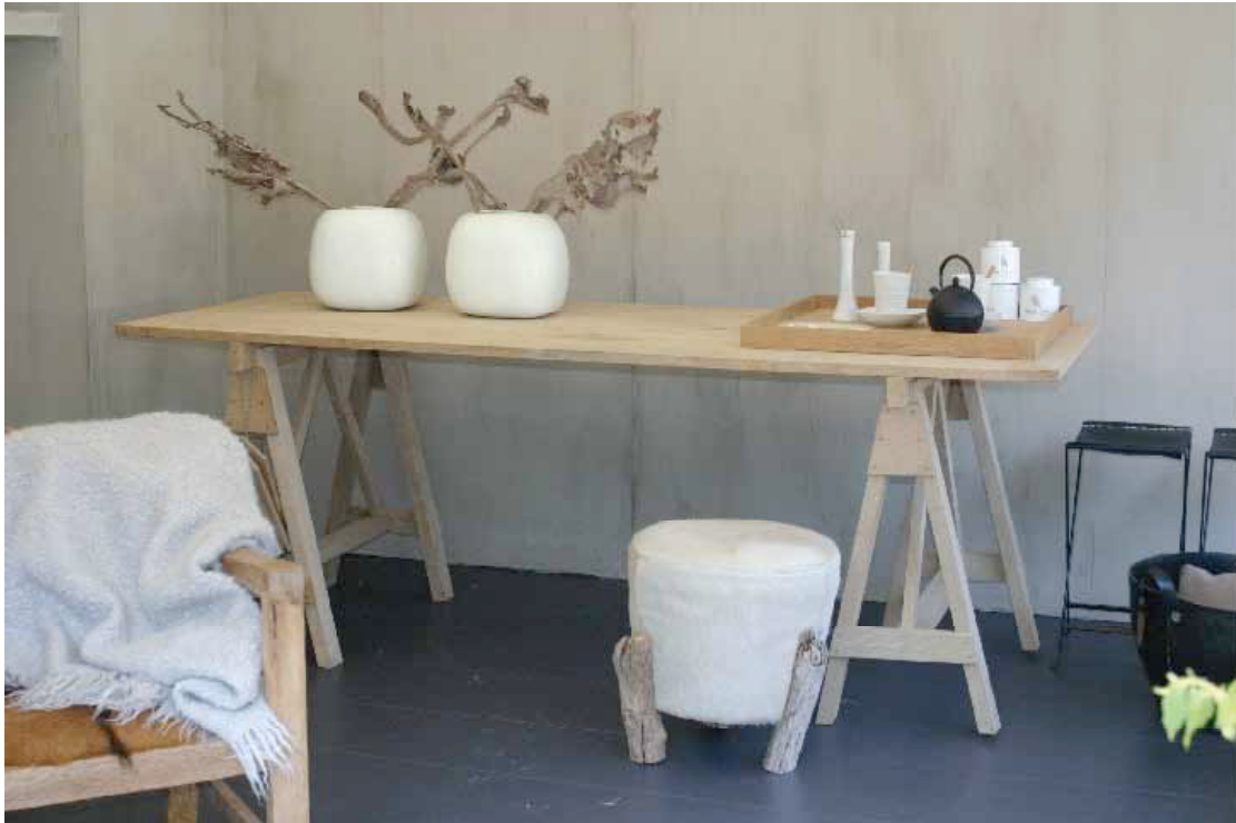
schraagtafel henry: 230 cm

Bij Malvini gaat de voorkeur naar natuurlijke en duurzame materialen waardoor het meubel een rijke en tijdloze uitstraling krijgt.